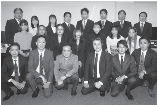
大手の税理士法人で相続業務経験を積んだ専門家が多数在籍。

財産を築くことは簡単なことではありません。所得税や社会保険料が控除され、生活費や学資金を支払